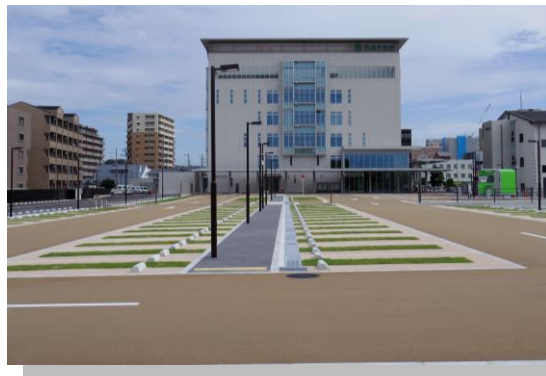
本庁舎屋外整備等工事及び植栽工事