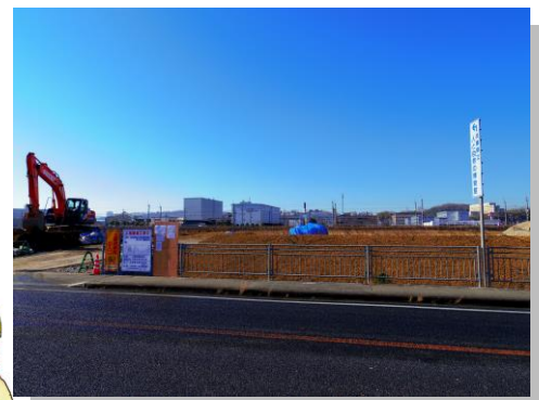
工事が始まった 福島土地整理事業