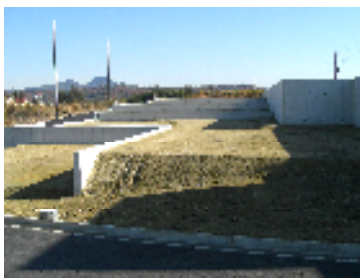
お客さんを待ち望む 7 街区