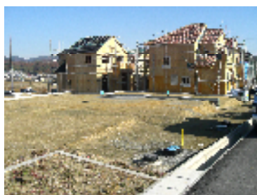
モデル建築が進む 4 街区

天神地区は、三田の地名の由来とされる御本尊を祀る金心寺や、九鬼藩の祈願所でもある天満神社、その境内には三田の桜の名所でもある天神公園などがあり、又、ここから見る眺望は市街地が見渡せる絶好の住環境だと思います。地区内には市道天神武庫が丘線の整備も進み、いよいよ新しい街づくりが始まります。そんなお手伝いが少し出来たと喜んでます。ありがとうございました。