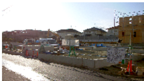
モデル住宅の建築も進む現場

新しい居住者が早く入居され、地区の皆さんと共に素晴らしい街並みが形成されることをお祈りします。