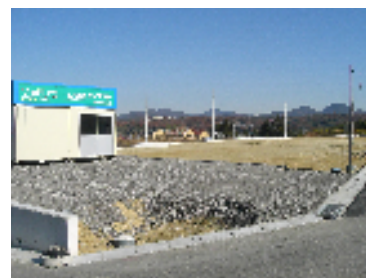
販売センターがある 8 街区