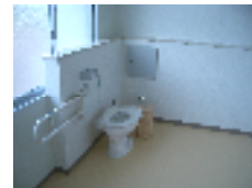
広々とした多目的トイレ