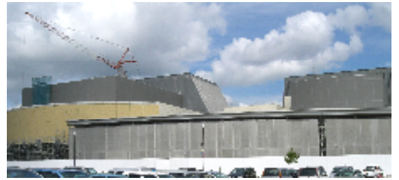
壮大なイメージの外観