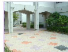
色鮮やかな屋外アプローチ