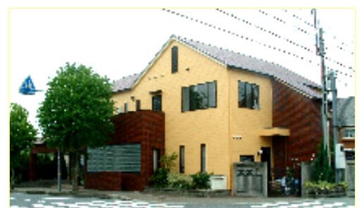
イメージ新の外観