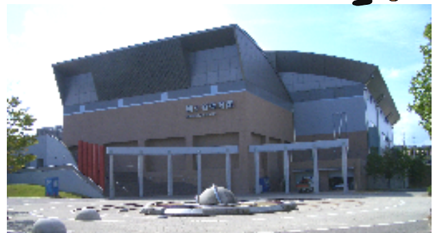
国体に向け準備万端の駒ヶ谷体育館