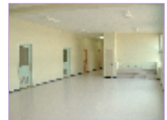
いろんな活動に便利な廊下